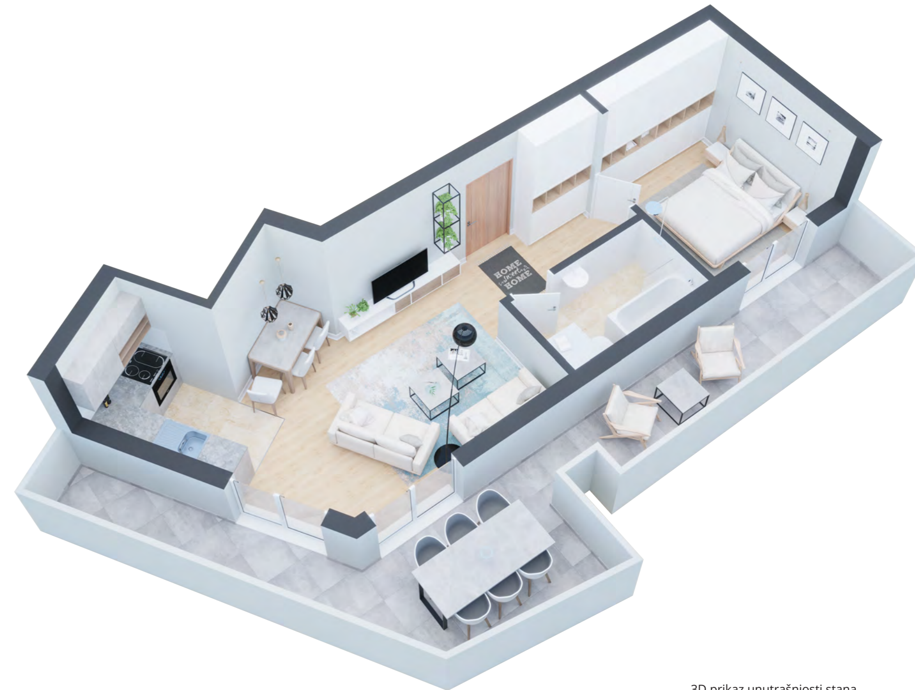
3D prikaz unutrašnjosti stana