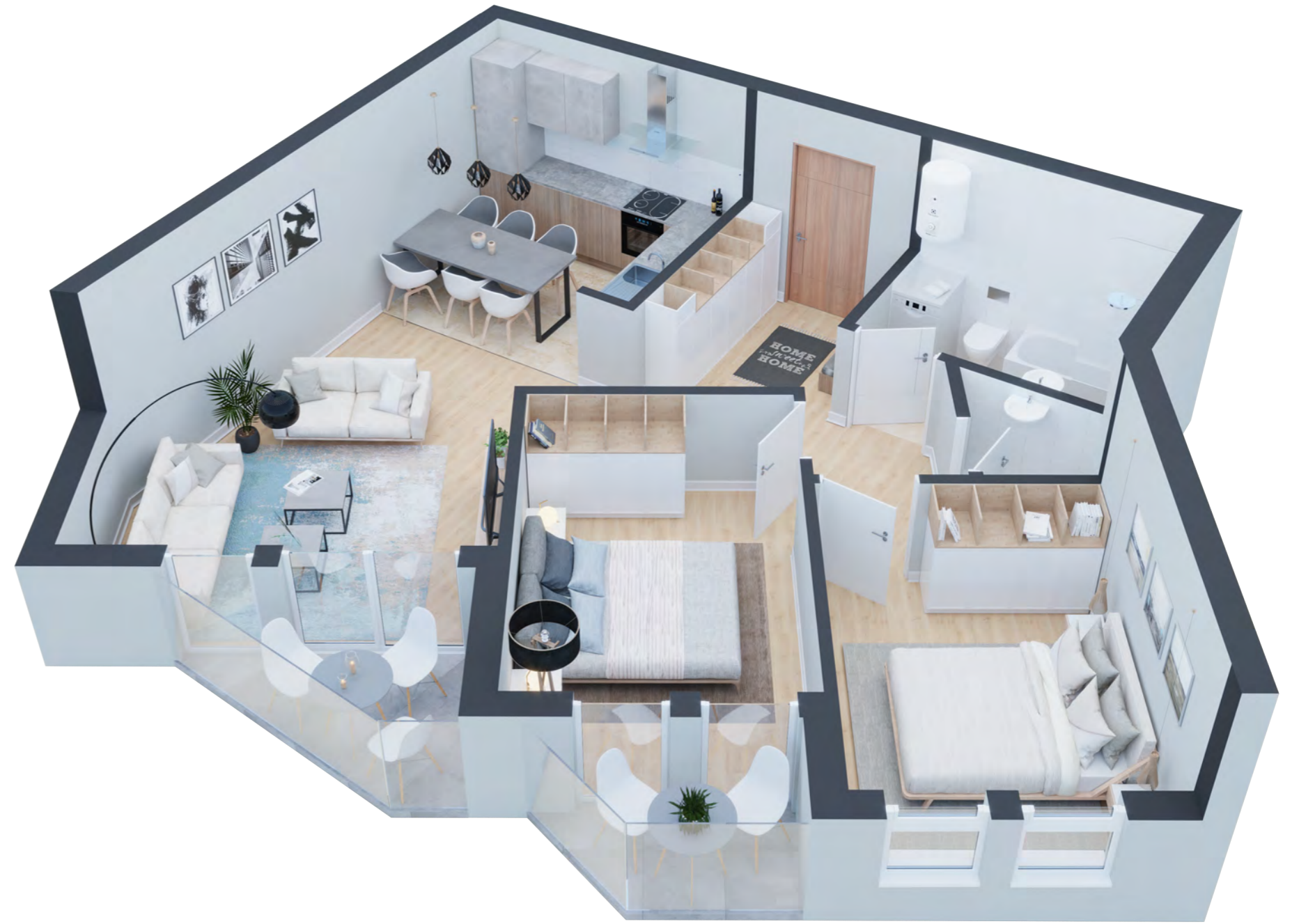
3D prikaz unutrašnjosti stana