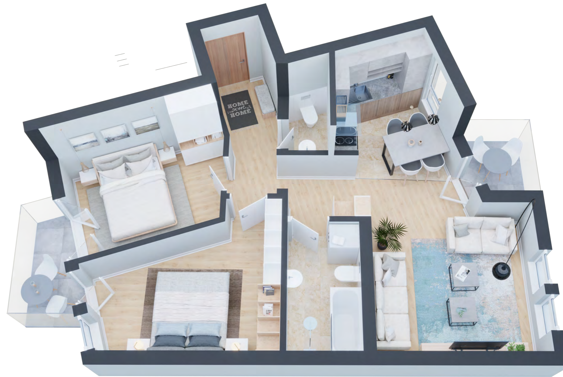
3D prikaz unutrašnjosti stana